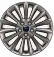
Jantes alliage 17" Gris Rock Metallic (de série)