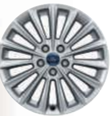
Jantes alliage 17" (en option)