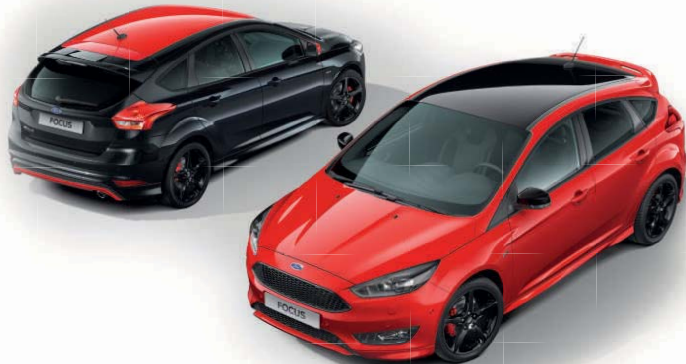
Modèles présentés : Focus ST-Line Black avec options Focus ST-Line Red avec options

Les finitions ST-Line Red & Black offre une expérience de conduite aussi dynamique que la ST-Line, avec en plus des touches d'originalité très distinctives. L'alliance unique des teintes de carrosserie Rouge Racing ou Noir Shadow avec le toit et les coques de rétroviseurs contrastés, ainsi que le kit carrosserie, reflètent parfaitement l'élégance et la sportivité de ce véhicule.