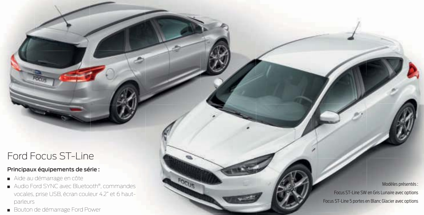
Modèles présentés : Focus ST-Line SW en Gris Lunaire avec options Focus ST-Line 5 portes en Blanc Glacier avec options

La nouvelle ST-Line allie l'incroyable polyvalence de la Focus à l'esthétisme plus audacieux d'un véhicule sportif. Le kit carrosserie, les calandres avant en nid d'abeilles, les jantes alliage Gris Rock Metallic, la suspension sport et les badges extérieurs ST-Line – autant d'éléments qui font de ce véhicule une combinaison unique entre praticité et sportivité.