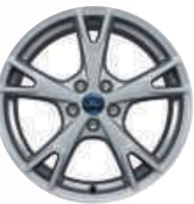
Jantes alliage 18" (en option)